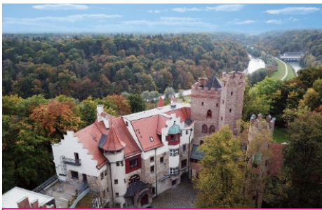
Das Bildungszentrum Burg Schwaneck von oben