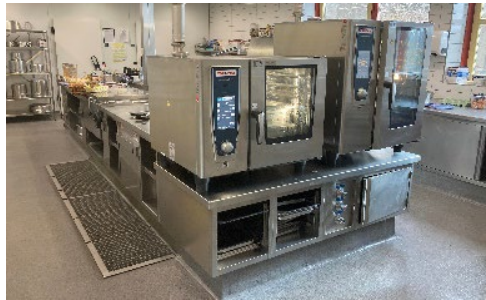
Arbeiten in einer modern ausgestatteten Küche