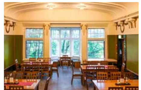
Gemeinsam genießen im historischen Speisesaal

Das Bildungszentrum Burg Schwaneck ist ein lebendiger und bunter Begegnungsort und nicht nur auf Grund der historischen Räume ein spannender Arbeitsplatz: In der modernen Küche mit viel Sonnenschein werden täglich 100 bis 150 gesunde Mahlzeiten für meist junge Gäste zubereitet. Wir freuen uns auf Verstärkung in unserem engagierten, aufgeschlossenen und interkulturellen Team.